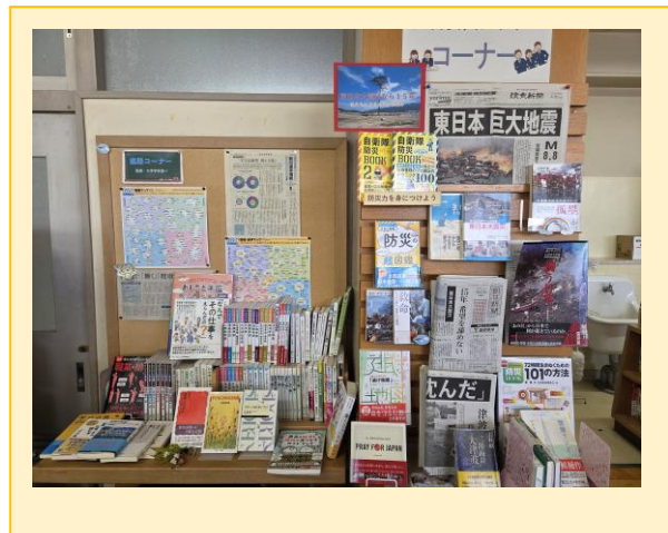
館内展示（進路・企画展示）